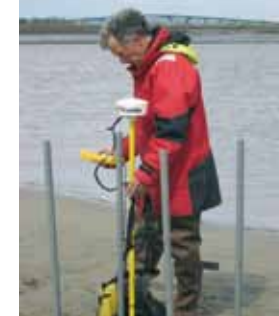
le suivi régulier de la topographie des vasières

La Maison de l'Estuaire est chargée de la gestion de la réserve naturelle depuis 1999. Cette mission est cadrée par le plan de gestion, qui définit les objectifs de conservation à long terme et le programme d'actions permettant de les atteindre. Tous les cinq ans, ces actions sont évaluées puis redéfinies par le gestionnaire en concertation avec les acteurs du territoire. La préservation de cette vaste zone humide repose notamment sur la gestion de l'eau dans le marais et sur l'entretien adapté des roselières, des prairies humides et des mares, en concertation avec les coupeurs de roseaux, les agriculteurs et les chasseurs de gibier d'eau.