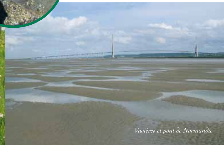
Vasières et pont de Normandie