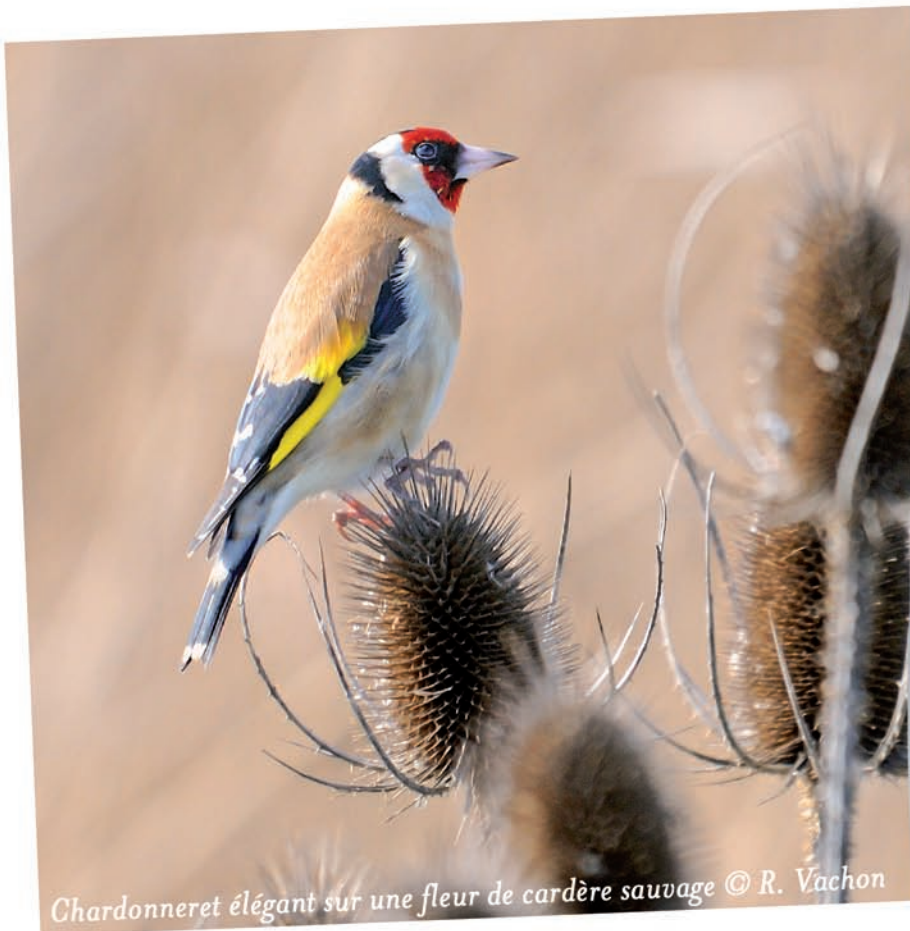
Chardonneret élégant sur une fleur de cardère sauvage

La Maison de l'Estuaire vous invite ainsi à participer aux derniers Mercredis Nature de l'année, organisés dans la Réserve naturelle de l'estuaire de la Seine. Des expériences à vivre en famille, pour se reconnecter avec la nature qui nous entoure !