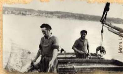
pêcheurs de Berville sur Mer ▶

Le passé de la commune de Berville-sur-Mer est marqué par l'activité de pêche. Jusqu'en 1960, « les chaloupes » partaient pour la pêche en mer. Des vieux gréements pratiquaient la pêche à la crevette dans l'estuaire. La chaloupe « l'Annick » est le témoin de ce passé dynamique. Le vieux gréement « La Fleur des flots » est quand à lui visible dans l'ancien port de Berville-sur-Mer (voir au point 5 de la fiche).