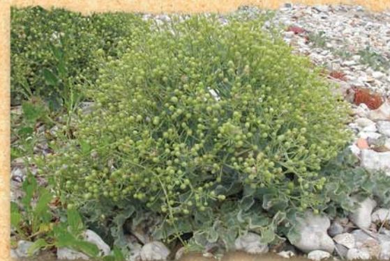
le chou ou crambe maritime Je suis un proche parent du chou alimentaire. Mes graines passent l'hiver enfouies sous les galets.

En contrebas sur votre gauche, vous apercevrez une petite plage de galets bien surprenante. Cette étroite bande qui vous sépare de la Seine abrite un trésor... de verdure. Il s'agit d'un chou bien singulier : le chou marin. Comme son nom l'indique il a la particularité d'être très bien adapté aux conditions de vie littorale : influence des marées, présence de sel. Soyez attentif à son égard car cette espèce est rare et protégée en France.