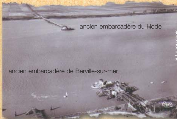
ancien embarcadère du Hode ancien embarcadère de Berville-sur-Mer

A partir de 1960, La traversée de la Seine devient possible par le pont de Tancarville. Après cette observation, suivez le chemin partant vers la droite.