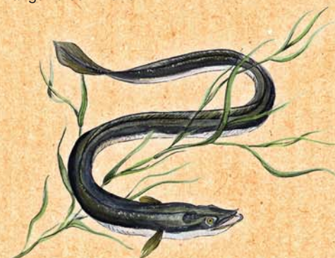
une anguille adulte ▲

L'anguille parcourt 5000 km pour aller se reproduire.