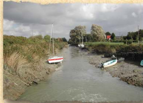
◀ le canal de retour avec des bateaux de plaisance

La vanne est ouverte à marée basse pour créer un fort courant vers la Risle et évacuer ainsi la vase accumulée au fond du canal. Comme vous pouvez le voir, quelques bateaux de plaisance viennent encore accoster à Berville-sur-Mer par l'intermédiaire de cette action.