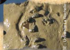
des hydrobies ▶

Chaque oiseau possède un bec adapté à la capture de différentes proies.