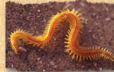
▲ le ver néreis